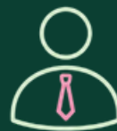
Auch für Selbstständige interessant